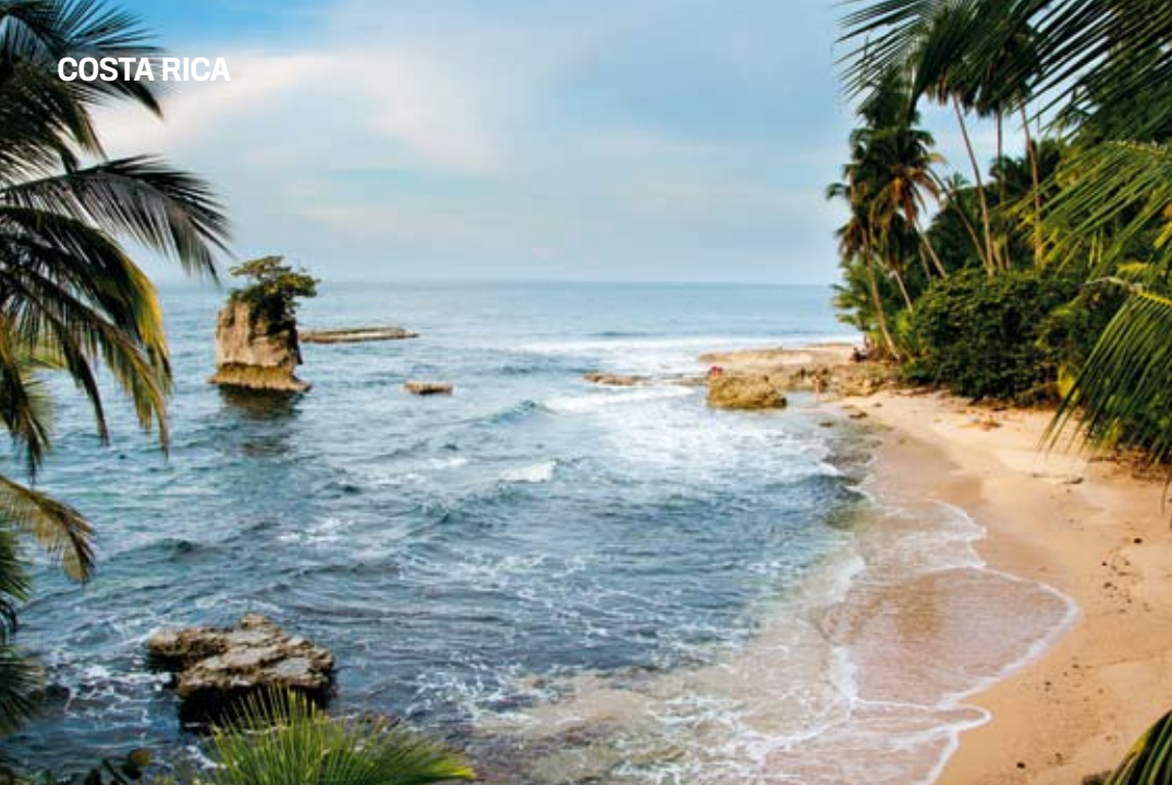
Playa de Manzanillo (arriba). Una oropel, serpiente venenosa y pequeña de la selva (centro). Los turistas interactúan con los monos en el Centro de Rescate Jaguar (abajo).